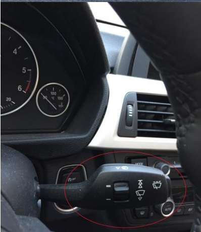
Kontakt Visker / Vasker