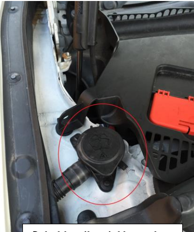
Beholder til sprinklervæske