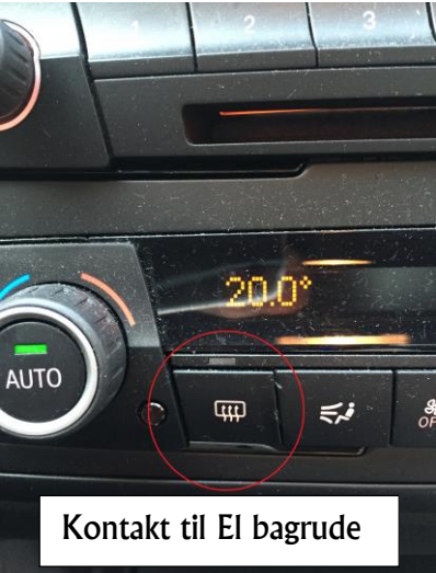
Kontakt til El bagrude