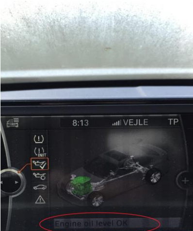
Måling af motorolieniveau