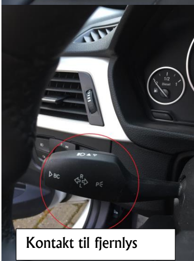
Kontakt til fjernlys