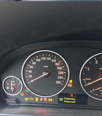
Kontrollampe for valg af lys