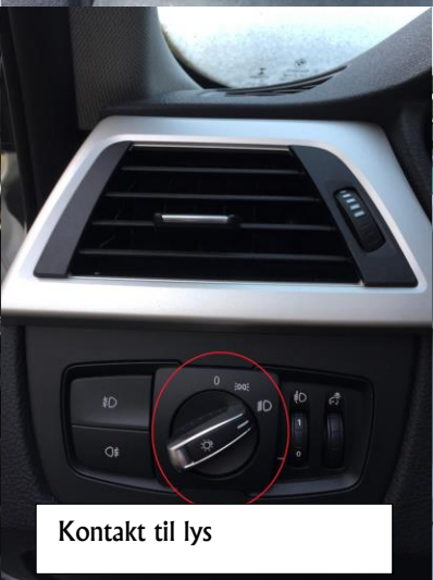
Kontakt til lys