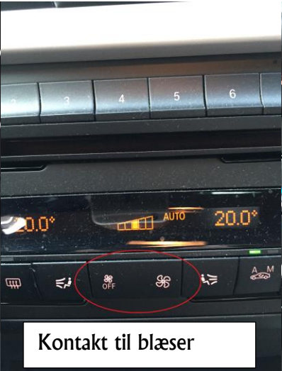
Kontakt til blæser